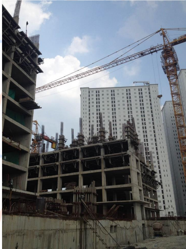
Gambar 6: Safety Net yang dipasang yang merupakan bagian program dari K3